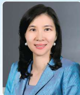
นางฉินทรา โสภณพนิช อุปนายกคนที่ 2 และเหรัญญิก