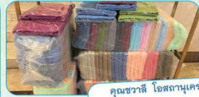
คุณชวาลี โอสธานุเคราะห์ บริจาคผ้าเช็ดตัว ชมรมผู้รู้คุณแผ่นดิน เพื่อมอบให้ทหาร จำนวน 128 ผืน